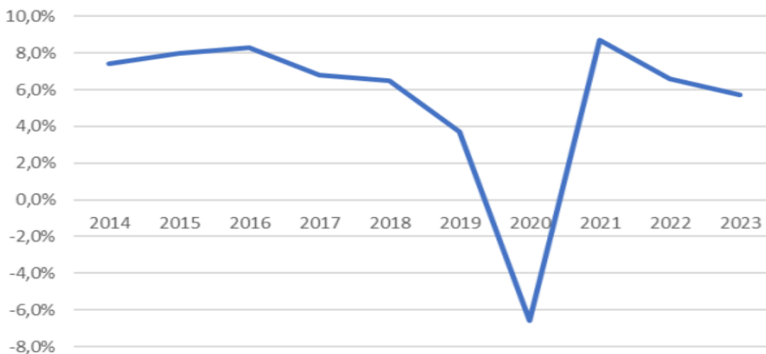
Рис. 1. Темпы роста ВВП Индии 1

Важным показателем активного вовлечения Индии в глобальную мировую повестку является ее председательство в G20 (2023 год) – это решающая возможность для страны продемонстрировать свои лидерские качества и продвинуть программу глобального