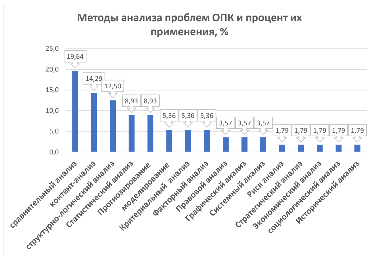
Рис. 5. Используемые методы анализа проблем ОПК (получено авторами)