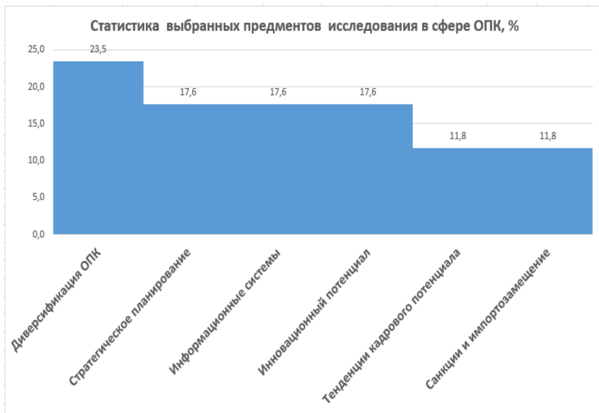
Рис.4. Гистограмма значимости выбранных предметов исследования в сфере ОПК (получено авторами)

На рисунке 4 представлена гистограмма выбранных предметов исследования в сфере ОПК, некоторые направления исследования были объединены по тематическому признаку. Как видно, проблемы диверсификации ОПК и проблемы связанные со стратегическим планированием доминируют в общем списке проблем