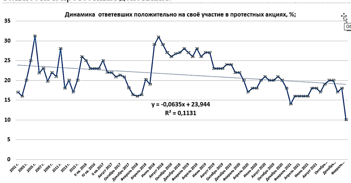
Рис.2. Динамика готовности к протестным действиям (данные ВЦИОМ)