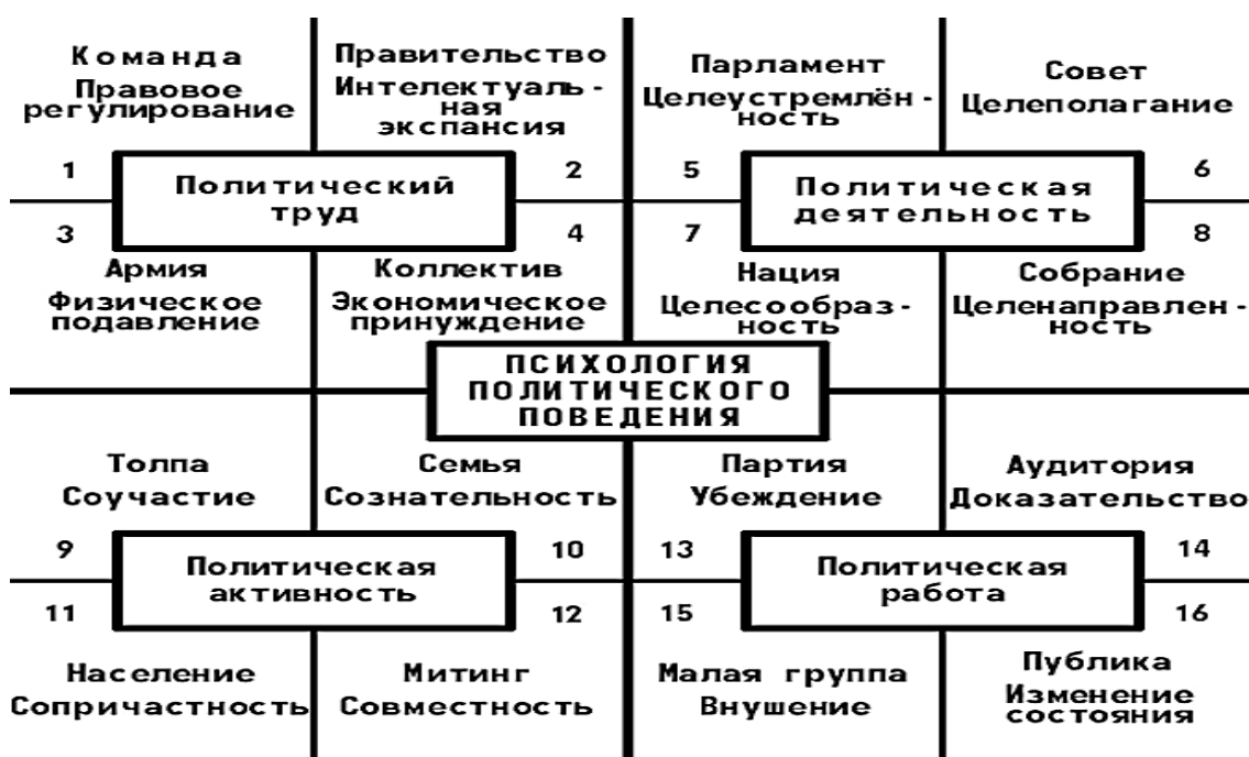
Рис.3. Психология политического поведения (+/-) и воздействия (+/-)

После приведения теоретических подходов к определению и анализу деструктивного поведения в современной науке, необходимо также разобрать общественно-политическую сторону формирования и осуществления деструктивного поведения. Эта тема также является предметом изучения [4, 5, 7, 8, 10]. На рисунке 3 приведена общая схема психологии политического поведения.